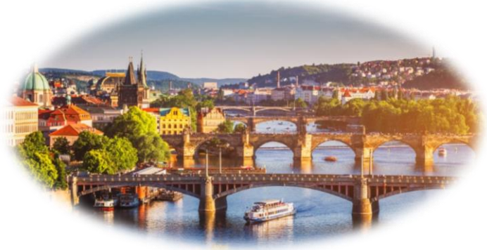
Η πανέμορφη παλιά πόλη της Πράγας, μνημείο της UNESCO, πάνω στον ποταμό Μολδάβα

Ακόμα κι αν δεν έχεις πάει στην Πράγα, σίγουρα έχεις μία εικόνα της. Έχεις δει σε φωτογραφίες τις χρυσές στέγες της. Έχεις δει τα παράξενα γοτθικά κτήρια με τα τερατόμορφα στολίδια που δεν καταλαβαίνεις αν σχεδιάστηκαν από τους αρχιτέκτονες πριν αιώνες για να τρομοκρατούν τους περαστικούς ή για να χλευάσουν την καταπίεση της Αγίας Ρωμαϊκής Αυτοκρατορίας. Επίσης ξέρεις από την Πράγα το Μαύρο Θέατρο, τον Κάφκα, τον Κούντερα. Και βέβαια έχεις ακουστά την Άνοιξη της Πράγας και τη Βελούδινη Επανάσταση... Όλα αυτά δεν είναι λίγα. Όλα αυτά, μαζί με ό,τι πούμε παρακάτω για τη γοητευτική αυτή πρωτεύουσα της Τσεχίας, δείχνουν ότι η Πράγα είναι μία πόλη που ανά τους αιώνες χορεύει με την ιστορία – και μάλιστα διαλέγει μόνη της τα βήματα αυτού του χορού.