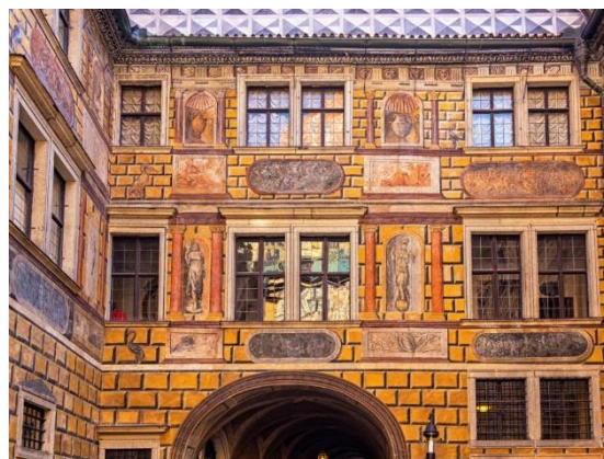
Οι ζωγραφισμένοι τοίχοι στα μεσαιωνικά σπίτια είναι κάτι σύνηθες στο Τσέσκυ Κρούμλοβ. Στη φωτογραφία βλέπουμε ζωγραφισμένο τοίχο του μεσαιωνικού κάστρου

Η προσωπικότητα όμως που δεσπάζει μοιραία στη γραφική αυτή πόλη είναι ο κορυφαίος αυστριακός ζωγράφος Έγκον Σίλε, ο οποίος θεωρείται ιδιοφυΐα της αρ νουβώ ζωγραφικής και είναι παγκοσμίως διάσημος για τα όλο ένταση πορτραίτα του – αγαπημένα θέματά του ήταν οι εταιρες των αρχών του 20ου αιώνα. Η μητέρα του καταγόταν από το