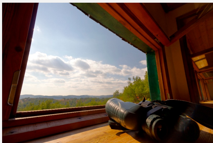
Στο Παρατηρητήριο του Δάσους Δαδιάς