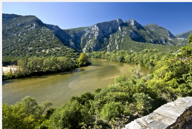
Στην κοιλάδα του Νέστου