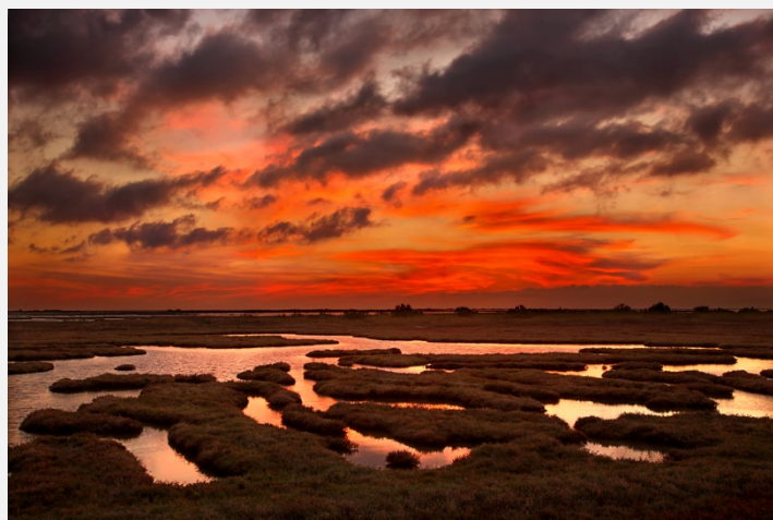
Δέλτα του Έβρου