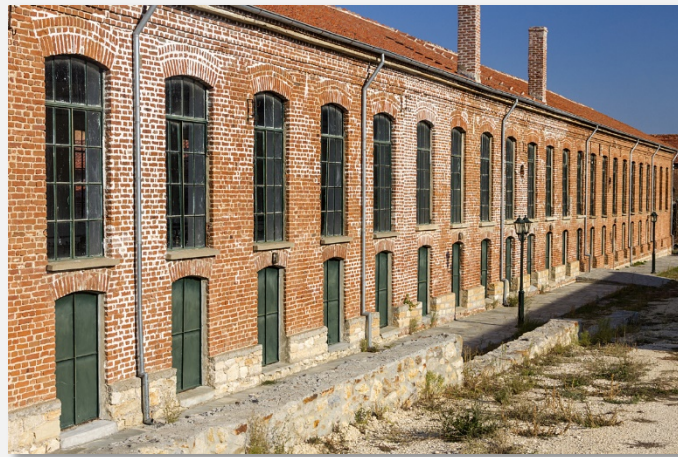
Το παλιό μεταξουργείο Τζίβρε, στο Σουφλί

Μετά το πρωινό, αφήνουμε την πόλη της Αλεξανδρούπολης και ακολουθώντας την Εγνατία κατευθυνόμαστε προς τα Στενά του Νέστου. Θα φτάσουμε στο παραποτάμιο δάσος του Νέστου και στο χωριό Τοξότες για να θαυμάσουμε την υπέροχη και μοναδική φύση που έχει ανακηρυχθεί «Αισθητικό Δάσος» από το 1977. Με όλες αυτές τις εξαιρετικές εικόνες θα πάρουμε τον δρόμο της επιστροφής.