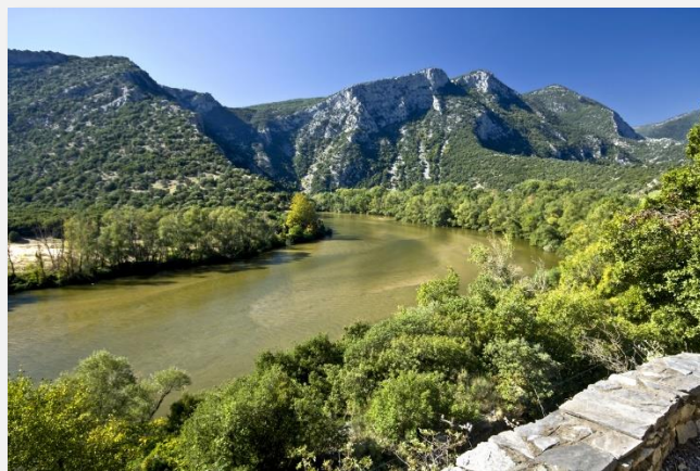
Στην κοιλάδα του Νέστου