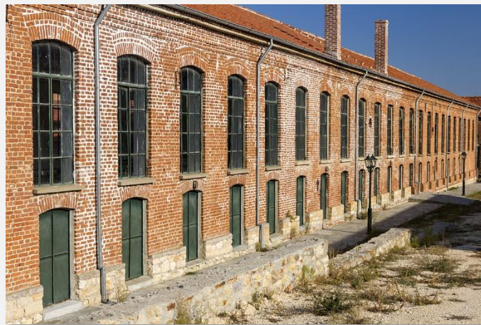
Το παλιό μεταξουργείο Τζίβρε, στο Σουφλί

Μετά το πρωινό, αφήνουμε την πόλη της Αλεξανδρούπολης και ακολουθώντας την Εγνατία κατευθυνόμαστε προς τα Στενά του Νέστου. Θα φτάσουμε στο παραποτάμιο δάσος του Νέστου και στο χωριό Τοξότες για να θαυμάσουμε την υπέροχη και μοναδική φύση που έχει ανακηρυχθεί «Αισθητικό Δάσος» από το 1977. Με όλες αυτές τις εξαιρετικές εικόνες θα πάρουμε τον δρόμο της επιστροφής.