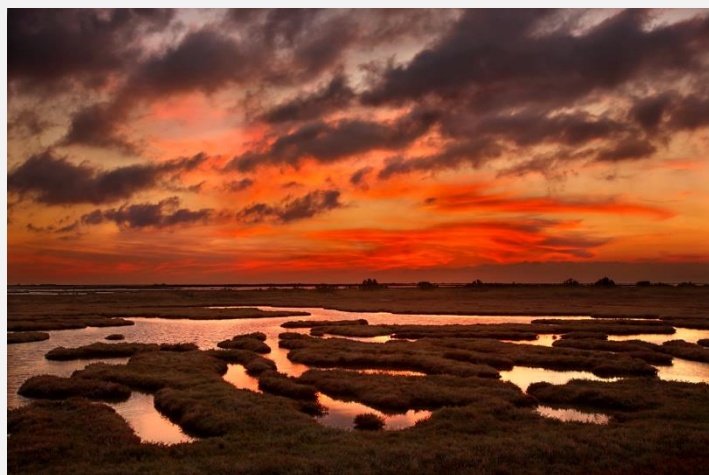
Δέλτα του Έβρου