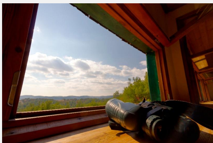
Στο Παρατηρητήριο του Δάσους Δαδιάς