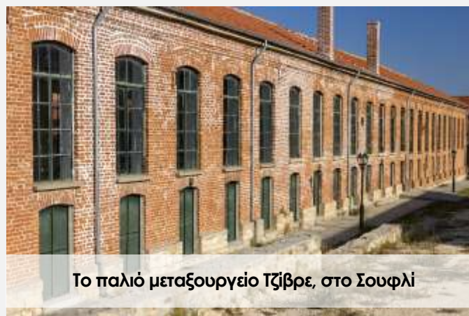
Το παλιό μεταξουργείο Τζίβρε, στο Σουφλί