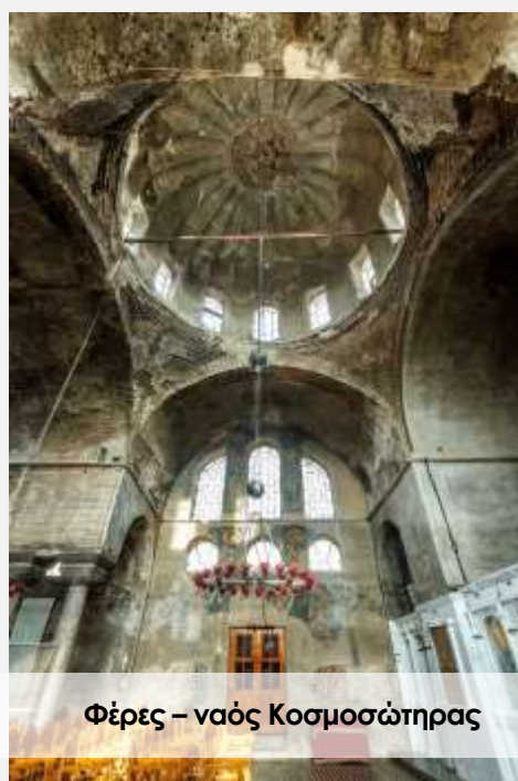
Φέρες – ναός Κοσμοσώτηρας

Το παραπάνω πρόγραμμα είναι ενδεικτικό. Το τελικό ενημερωτικό αποστέλλεται περίπου 3-5 ημέρες πριν από την εκάστοτε αναχώρηση.