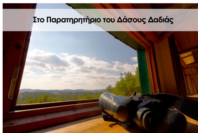
Στο Παρατηρητήριο του Δάσους Δαδιάς