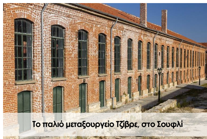
Το παλιό μεταξουργείο Τζίβρε, στο Σουφλί