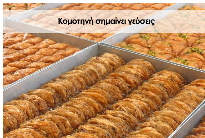
Κομοτηνή σημαίνει γεύσεις