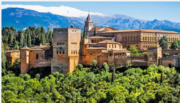
Ανάκτορο της Αλάμπρα