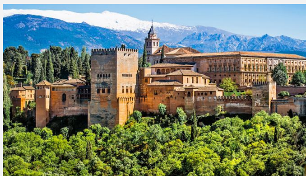
Ανάκτορο της Αλάμπρα