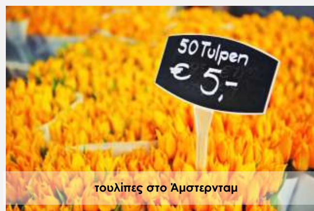
τουλίπες στο Άμστερνταμ