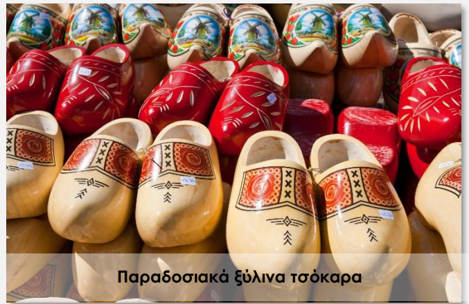
Παραδοσιακά ξύλινα τσόκαρα

Το τελικό ενημερωτικό αποστέλλεται περίπου 3-5 ημέρες πριν από την εκάστοτε αναχώρηση.