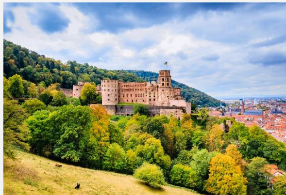
Το κάστρο της Χαϊδελβέργης

Σήμερα μετά το πρωινό μας στο ξενοδοχείο θα αναχωρήσουμε οδικώς για την περιοχή του διάσημου Μέλανα Δρυμού. Πρόκειται για τον σημαντικότερο πνεύμονα πρασίνου της Ευρώπης – ένα πυκνό καταπράσινο δάσος που εκτείνεται από τον Ρήνο ως τον Δούναβη. Η πρώτη στάση μας είναι το κοσμοπολίτικο Μπάντεν Μπάντεν , φημισμένο για τα ιαματικά λουτρά και το καζίνο του. Εδώ θα έχουμε χρόνο στη διάθεσή μας για έναν περίπατο, προκειμένου να πάρουμε μια γεύση από την αρχοντική αυτή πολιτεία που σαγήνευσε τσάρους, αυτοκράτορες και κάθε λογής γαλαζοαιματους της Γηραιάς Ηπείρου. Μετά το Μπάντεν Μπάντεν θα οδεύσουμε προς την πανέμορφη Λίμνη Τιτι , δημιούργημα