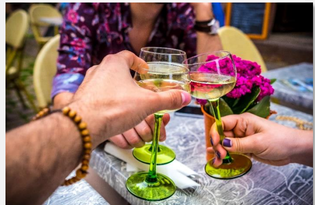
Κρασι Αλσατίας στην υγιά σας!