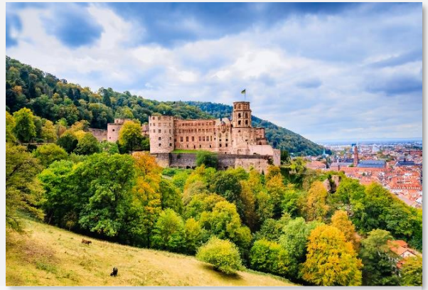
Το κάστρο της Χαϊδελβέργης

Σήμερα μετά το πρωινό μας στο ξενοδοχείο θα αναχωρήσουμε οδικώς για την περιοχή του διάσημου Μέλανα Δρυμού. Πρόκειται για τον σημαντικότερο πνεύμονα πρασίνου της Ευρώπης – ένα πυκνό καταπράσινο δάσος που εκτείνεται από τον Ρήνο ως τον Δούναβη. Η πρώτη στάση μας είναι το κοσμοπολίτικο Μπάντεν Μπάντεν , φημισμένο για τα ιαματικά λουτρά και το καζίνο του. Εδώ θα έχουμε χρόνο στη διάθεσή μας για έναν περίπατο, προκειμένου να πάρουμε μια γεύση από την αρχοντική αυτή πολιτεία που σαγήνευσε τσάρους, αυτοκράτορες και κάθε λογής γαλαζοαιματους της Γηραιάς Ηπείρου. Μετά το Μπάντεν Μπάντεν θα οδεύσουμε προς την πανέμορφη Λίμνη Τιτί , δημιούργημα