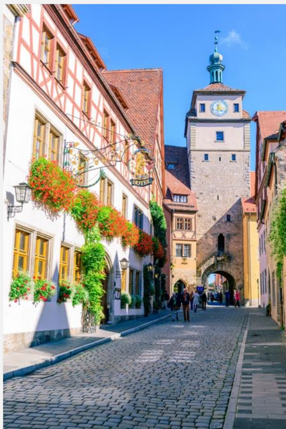
Ρότενμπουργκ ομπ ντερ Τάουμπερ

Μετά το πρωινό μας θα περιηγηθούμε στην πόλη που μας φιλοξένησε. Θα κινηθούμε στην Παλιά Κεντρική Γέφυρα κατά μήκος του ποταμού Μείν που χρονολογείται από τον 16ο αιώνα και θα επισκεφτούμε την κεντρική πλατεία με το παλιό δημαρχείο που βρίσκεται ανάμεσα στην Παλιά Κεντρική Γέφυρα και τον Καθεδρικό Ναό του St. Kilian με τον ρωμανικό πύργο, που ξεχωρίζει στην πόλη. Στην συνέχεια θα αναχωρήσουμε για την όμορφη πόλη Κόμπλεντς , στη συμβολή του Ρήνου με τον ποταμό Μοζέλα. Ακριβώς εκεί όπου ενώνονται τα νερά των δύο ποταμών θα δούμε τον πελώριο ανδριάντα του Κάιζερ Γουλιέλμου Β', μνημείο-σύμβολο της γερμανικής ενότητας. Θα δούμε επίσης τον καθεδρικό ναό του Αγίου Κάστορα, στη βόρεια πλευρά της πόλης. Θα έχουμε ελεύθερο χρόνο για βόλτα ή για ένα γεύμα σε τοπικό εστιατόριο και συνεχίζουμε για Μπάκαραχ , μια μικρή κωμόπολη στις όχθες του Ρήνου. Εκεί θα επιβιβαστούμε σε ποταμόπλοιο για μια μίνι κρουαζιέρα κατά μήκος του Μέσου Ρήνου μέχρι την πόλη Κόμπλεντς. Βρισκόμαστε σε μια περιοχή-μνημείο της UNESCO χάρη στα πολλά κάστρα που οι τοπικοί ηγεμόνες έχτιζαν κάποτε στις πλαγιές των καταπράσινων λόφων που κατεβαίνουν προς τις όχθες, και που σήμερα αποτελούν εξαιρετικά δείγματα μπαρόκ αρχιτεκτονικής. Κατά τη διάρκεια του πλου θα δούμε τον πολυθρύλητο βράχο της Λόρελαι, ντυμένο με μεσαιωνικές ιστορίες που σφράγισαν τον γερμανικό ρομαντισμό. Η κρουαζιέρα μας θα ολοκληρωθεί και εν συνεχεία θα μεταφερθούμε οδικώς στην γοητευτική Χαϊδελβέργη, όπου και θα διανυκτερεύσουμε.