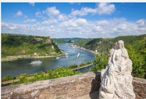
Η Λορελάι στον Ρήνο