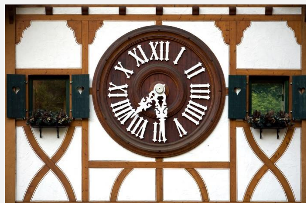
Χαρακτηριστικό ρολόι στην Uhrenstrasse, τον Δρόμο των Ρολογιών, στον Μέλανας Δρυμό