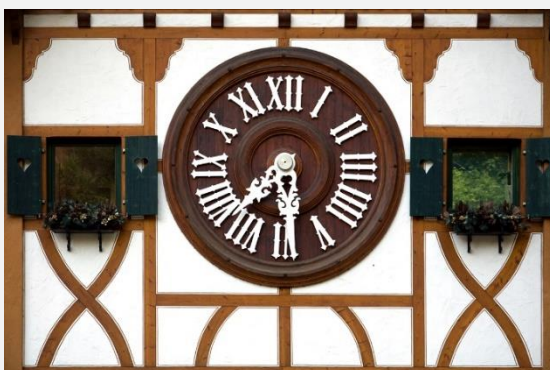
Χαρακτηριστικό ρολόι στην Uhrenstrasse, τον Δρόμο των Ρολογιών, στον Μέλανα Δρυμό