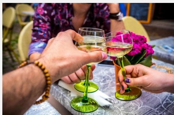
Κρασί Αλσατίας στην υγεία σας!