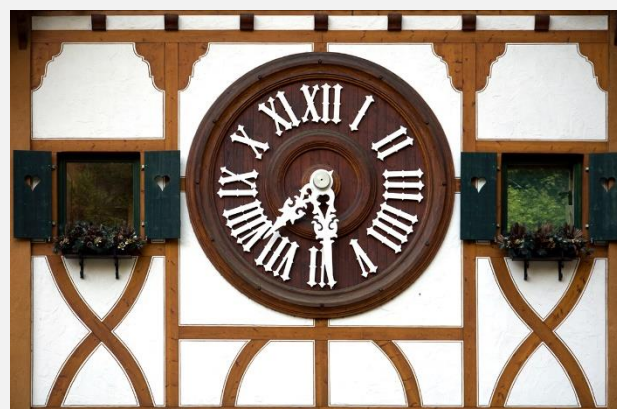
Χαρακτηριστικό ρολόι στην Uhrenstrasse, τον Δρόμο των Ρολογιών, στον Μέλανα Δρυμό