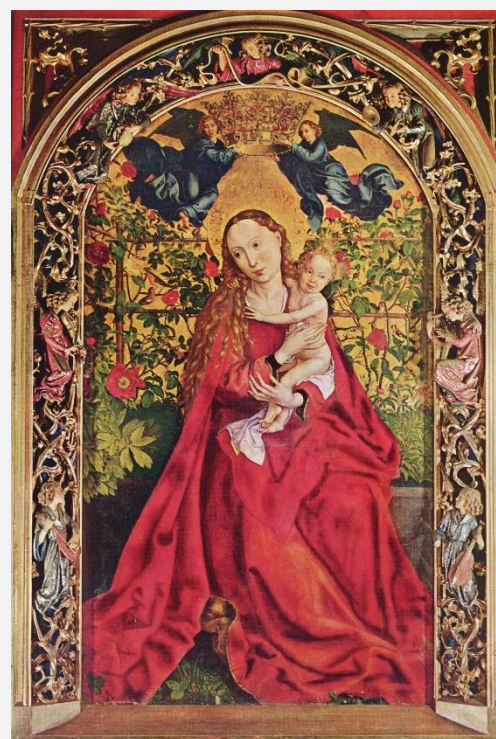
«Παναγία του Ροδόκηπου», έργο του Σονγκάουερ, στον καθεδρικό του Αγίου Μαρτίνου, στην Κολμάρ.