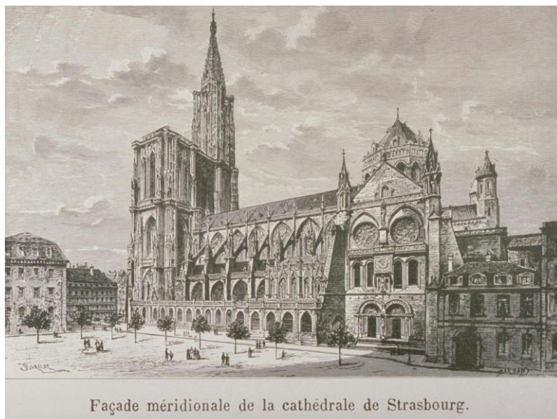
Façade méridionale de la cathédrale de Strasbourg.