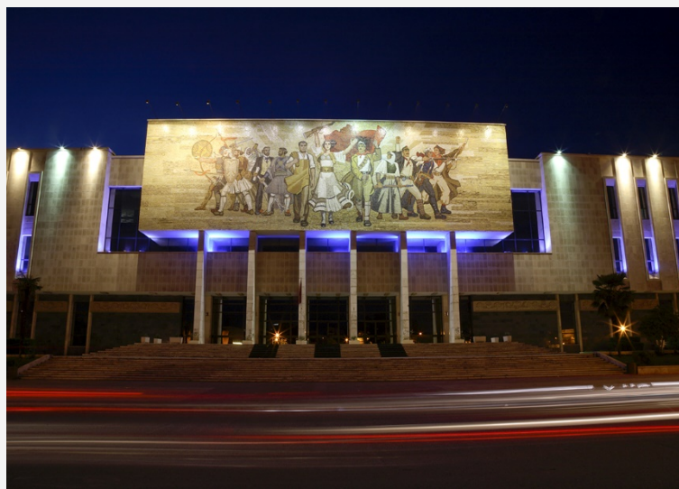
Εθνικό Μουσείο, Τίρανα