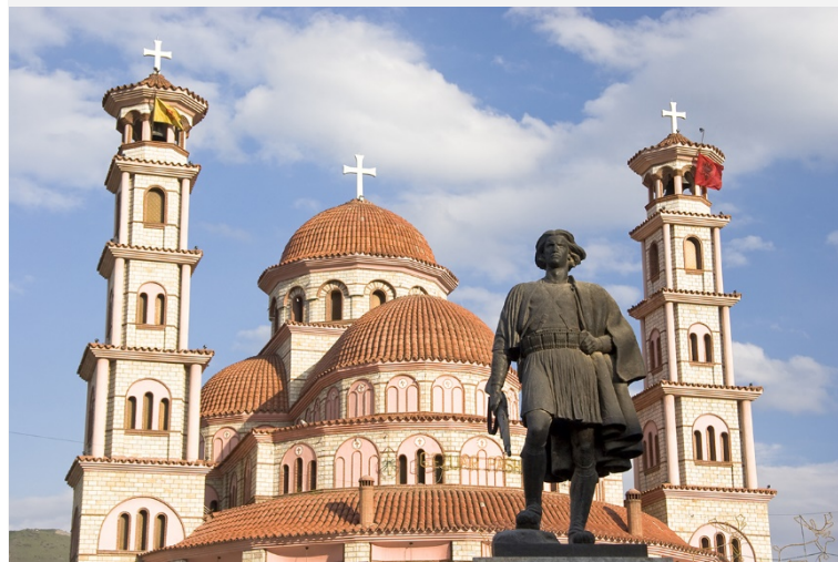
Άγιος Γεώργιος, Κορυτσά