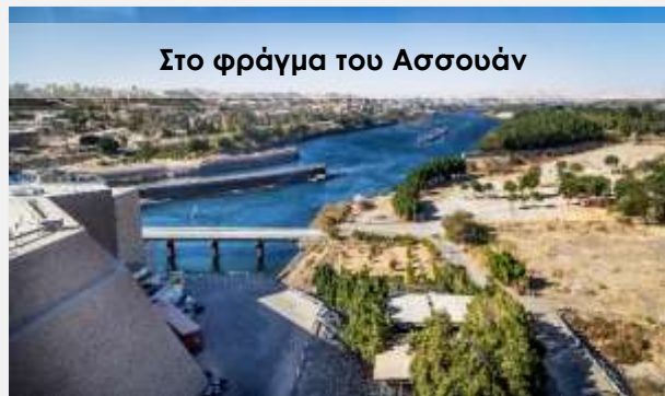
Στο φράγμα του Ασσουάν

Κατά την πλεύση μας για το Λούξορ θα περάσουμε την διώρυγα της Έσνα για να κατέβουμε επίπεδο. Γεύμα, δείπνο και διανυκτέρευση στο πλοίο, στην περιοχή του Λούξορ.