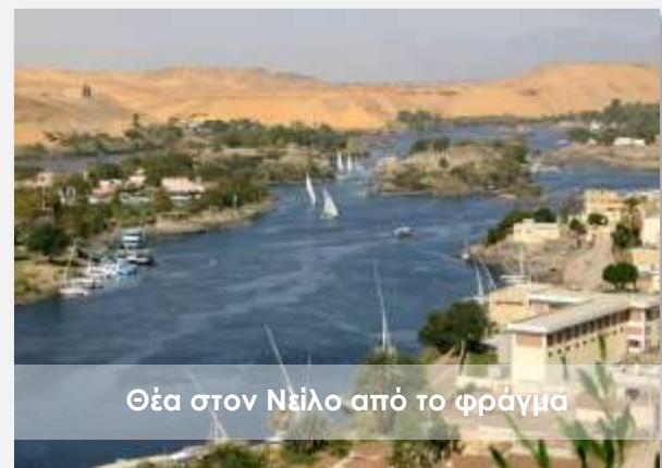
Θέα στον Νείλο από το φράγμα