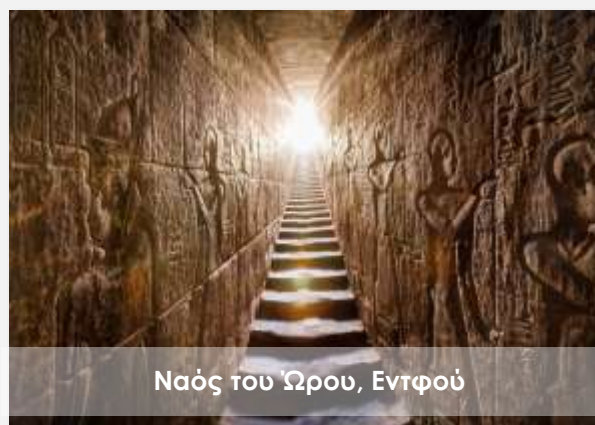
Ναός του Ώρου, Εντφού