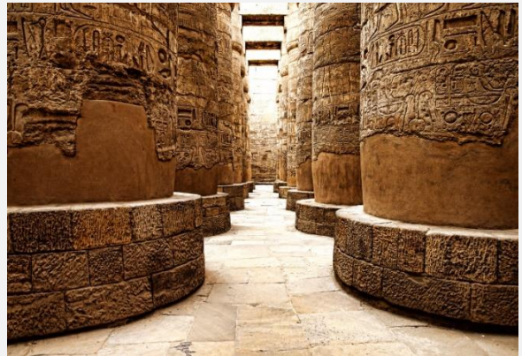
Ιερογλυφικά στο Καρνάκ