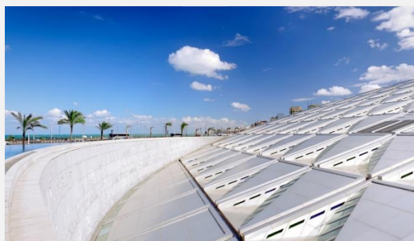
Βιβλιοθήκη της Αλεξάνδρειας