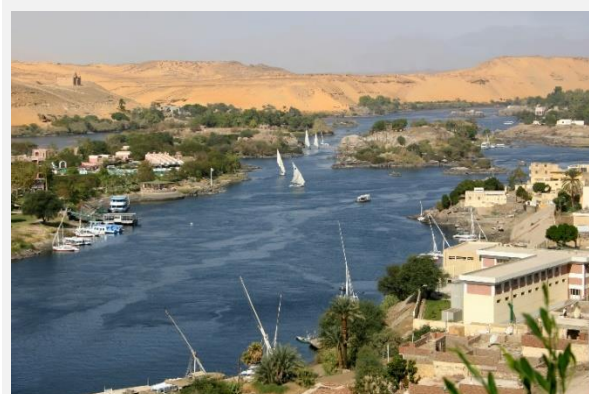
Θέα στον Νείλο από το φράγμα του Ασσουάν