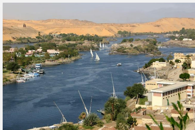
Θέα στον Νείλο από το φράγμα του Ασσουάν