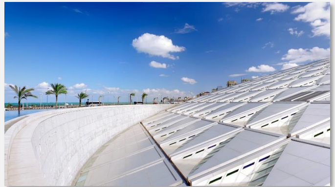
Βιβλιοθήκη της Αλεξάνδρειας