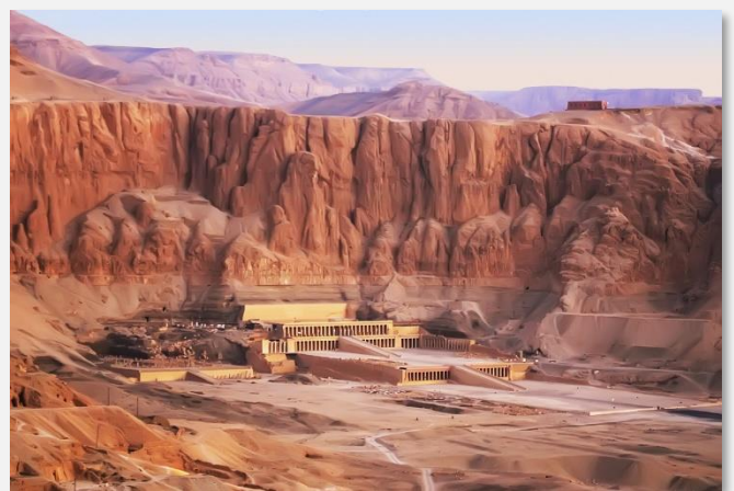
Το μαυσωλείο της Χατσεψούτ, στη δυτική όχθη του Λούξορ