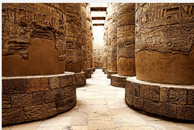
Ιερογλυφικά στο Καρνάκ