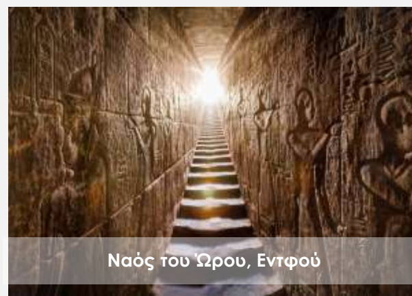
Ναός του Ώρου, Εντφού