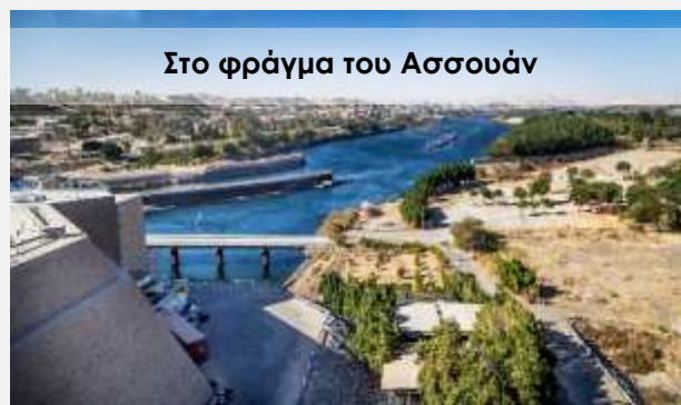
Στο φράγμα του Ασσουάν

Συνεχίζουμε για το Εντφού , την Απολλωνόπολη των Ελλήνων, όπου θα επισκεφθούμε τον Ναό του Ώρου, τον πιο καλοδιατηρημένο ναό της Αιγύπτου. Το Εντφού είναι το μέρος όπου διεξήχθη η μυθική μάχη μεταξύ του Ώρου και του κακού δαίμονος Σεθ, η οποία έληξε με την ήττα του δεύτερου, γεγονός που απεικονίζεται στις τοιχογραφίες. Στην είσοδο του ναού υπάρχει ένας πυλώνας ύψους 36 μέτρων, με κολοσσιαίες παραστάσεις του Πτολεμαίου ΙΒ', που φρουρείται από δύο μεγάλα γρανιτένια γεράκια. Ακολουθεί η μεγάλη αίθουσα προσφορών του Ώρου, με τις υπέροχες τοιχογραφίες και δύο αίθουσες με μικρότερους