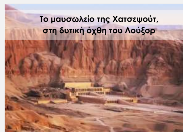
Το μαυσωλείο της Χατσεψούτ, στη δυτική όχθη του Λούξορ