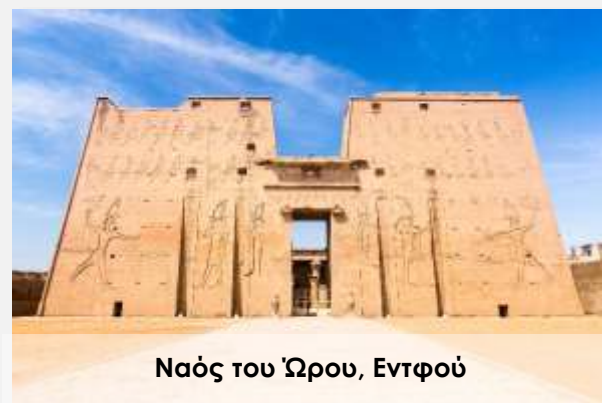
Ναός του Ώρου, Εντφού