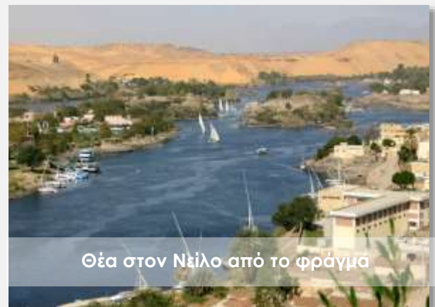
Θέα στον Νείλο από το φράγμα