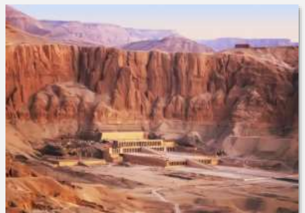
Το μαυσωλείο της Χατσεψούτ, στη δυτική όχθη του Λούξορ