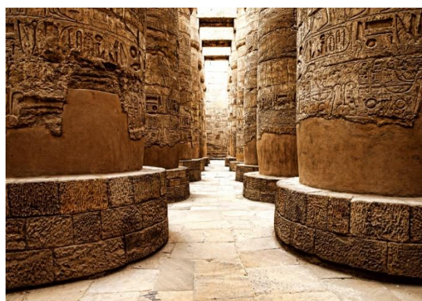
Ιερογλυφικά στο Καρνάκ