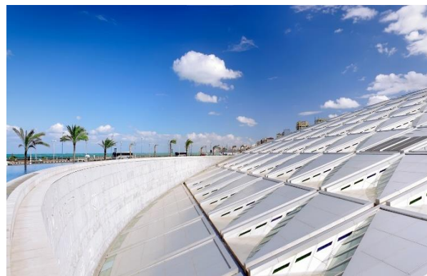
Βιβλιοθήκη της Αλεξάνδρειας

Το απόγευμα θα επισκεφθούμε τον ναό του Λούξορ , ο οποίος βρίσκεται μέσα στην πόλη, δίπλα στον Νείλο. Ο ναός αυτός, αφιερωμένος επίσης στη Θηβαϊκή Τριάδα. Ο ναός αυτός είναι καλύτερα