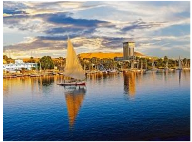
Φελούκα στο Ασουάν

ευρήματα ανθρωπίνης κατοικήσεως στην περιοχή χρονολογούμενα από την Νεολιθική Εποχή καθώς και φαραωνικοί ναοί με κυριότερο αυτόν του Χνουμ. Μετά τη βόλτα με τις Φελούκες για όποιον επιθυμεί (προαιρετικά), σας προτείνουμε να επισκεφτείτε την περιοχή των Νουβίων, ενός πολιτισμού 5000 χρόνων. Θα περιπλανηθούμε στα πολύχρωμα χωριά τους, θα δούμε πως ζουν και θα απολαύσουμε την φιλοξενία τους. Διανυκτέρευση εν πλω. Πρωινό, γεύμα και δείπνο κατά τη διάρκεια της ημέρας.