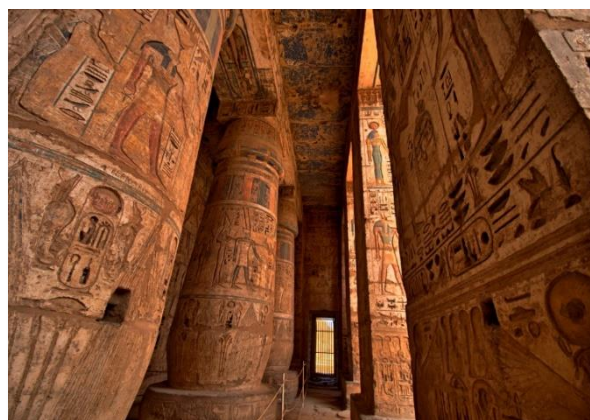
Ιερογλυφικά στους ναούς του Λούξορ