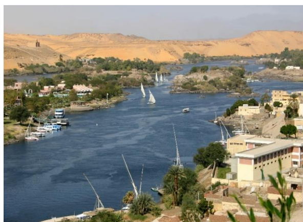
Θέα στον Νείλο από το φράγμα του Ασσουάν