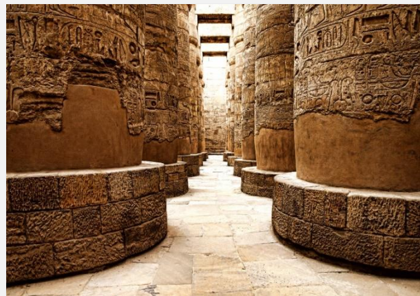
Ιερογλυφικά στο Καρνάκ