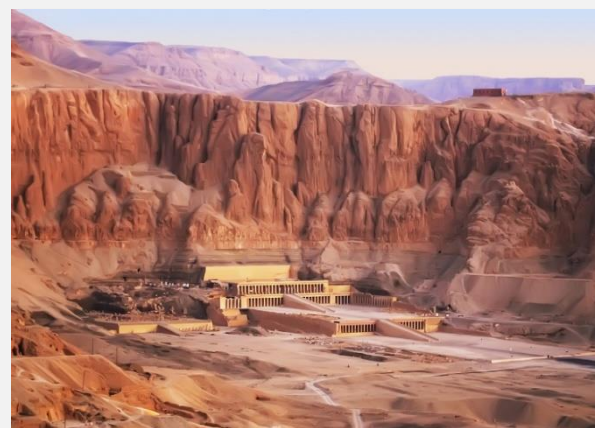
Το μαυσωλείο της Χατσεψούτ, στη δυτική όχθη του Λούξορ