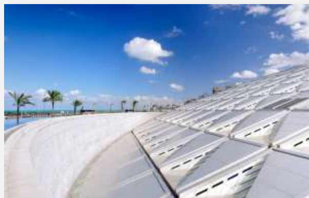
Βιβλιοθήκη της Αλεξάνδρειας

Το απόγευμα θα επισκεφθούμε τον μεγαλειώδη ναό του Καρνάκ, ένα τεράστιο σύμπλεγμα αφιερωμένο στη Θηβαϊκή Τριάδα, που εμπλουτίζεται από τον φαραώ Ραμσή II και επεκτάθηκε στους επόμενους αιώνες από πολλούς φαραώ. Η μεγαλοπρέπεια και το μέγεθος του ναού θα μας εντυπωσιάσει και θα μας συγκινήσει ιδιαίτερα όταν θα επισκεφθούμε το ιερό του Μεγάλου Αλεξάνδρου. Η ημέρα μας συνεχίζεται με τον ναό του Λούξορ, ο οποίος βρίσκεται μέσα στην πόλη, δίπλα στον Νείλο. Ο ναός αυτός, αφιερωμένος επίσης στη Θηβαϊκή Τριάδα. Ο ναός αυτός είναι καλύτερα επισκέψιμος βράδυ επειδή είναι ανοιχτός έως αργά και υποβλητικά φωτισμένος. Το βράδυ σας προτείνουμε να παρακολουθήσετε την