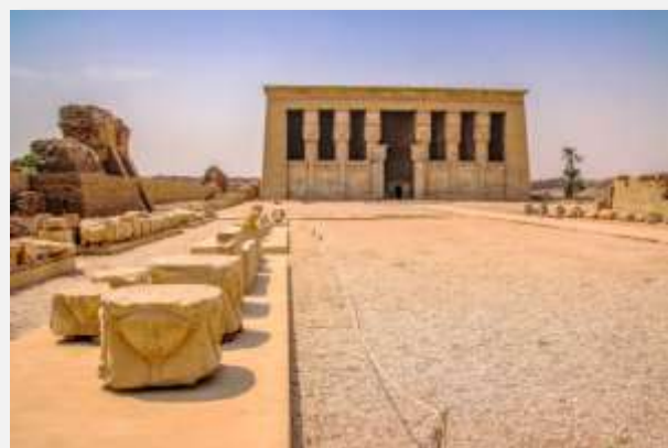
Ο ναός στη Δένδεννα