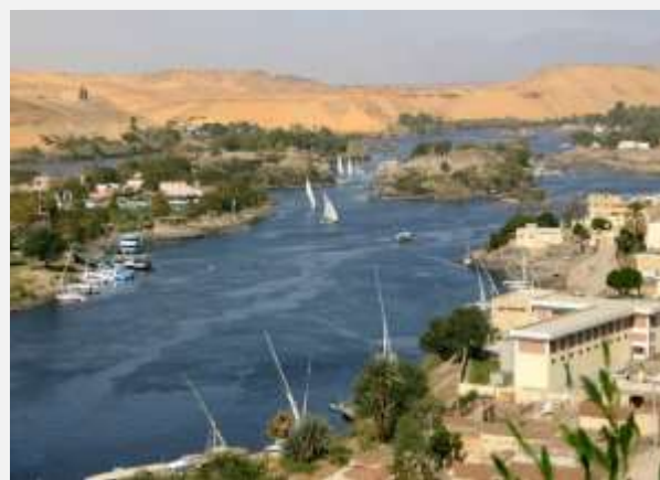
Θέα στον Νείλο από το φράγμα του Ασσουάν