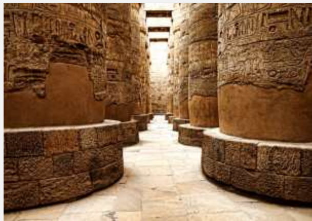
Ιερογλυφικά στο Καρνάκ