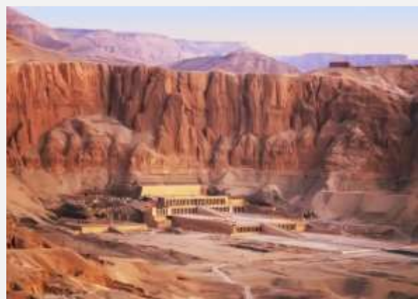
Το μαυσωλείο της Χατσεψούτ, στη δυτική όχθη του Λούξορ