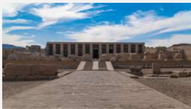
Ναός του Σέτι στην Άβυδο

Στην αναχώρηση 21/4 το πρόγραμμα είναι 10ήμερο και περιλαμβάνει μία (1) επιπλέον διανυκτέρευση στο Κάιρο, στην αρχή του προγράμματος, στο ξενοδοχείο Sheraton/Sofitel 5* με δείπνο μέσα στο ξενοδοχείο και ξενάγηση στο Παλιό Κάιρο και στο Μουσείο Πολιτισμού.