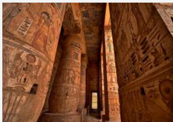
Ιερογλυφικά στους ναούς του Λούξορ