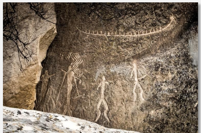
Βραχογραφίες στο Γκομπουστάν