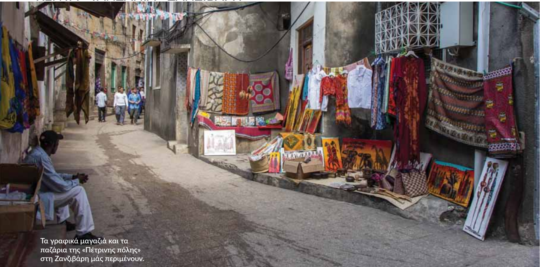
Τα γραφικά μαγαζιά και τα παζάρια της «Πέτρινης πόλης» στη Ζανζιβάρη μάς περιμένουν.

για τη λίμνη Εγιασί, όπου θα έχουμε την ευκαιρία να συναντήσουμε γηγενείς της περιοχής, οι οποίοι ζουν ακόμα σε πρωτόγονες συνθήκες. Θα δούμε μέλη της φυλής Χατζάμπε, που μέχρι και σήμερα χρησιμοποιούν σπηλιές για τη διαμονή τους, θα παρατηρήσουμε πώς ανάβουν φωτιές και ποια δέντρα χρησιμοποιούν για αυτό, θα μας δείξουν πώς συλλέγουν μέλι και θα μας διδάξουν πώς φτιάχνουν φάρμακα από φυσικά προϊόντα που γιατρεύουν βαριές ασθένειες. Αργότερα θα επισκεφθούμε τη φυλή Ντατόγκα, η οποία ασχολείται κυρίως με την κτηνοτροφία και τρέφεται με παράγωγα των ζώων και καρπούς. Οι Ντατόγκα ζουν σαν νομάδες και μετακινούνται από μέρος σε μέρος για να βρουν τροφή για τα ζώα τους. Θα έχουμε, επίσης, την ευκαιρία να δούμε τους σιδεράδες της φυλής να φτιάχνουν όπλα, όπως μαχαίρια, τόξα με δηλητήριο και δόρατα, με τη δική τους παραδοσιακή μέθοδο. Στη συνέχεια θα μεταφερθούμε στη λίμνη Μανιάρρα όπου θα διανυκτερεύσουμε σε λοντζ.