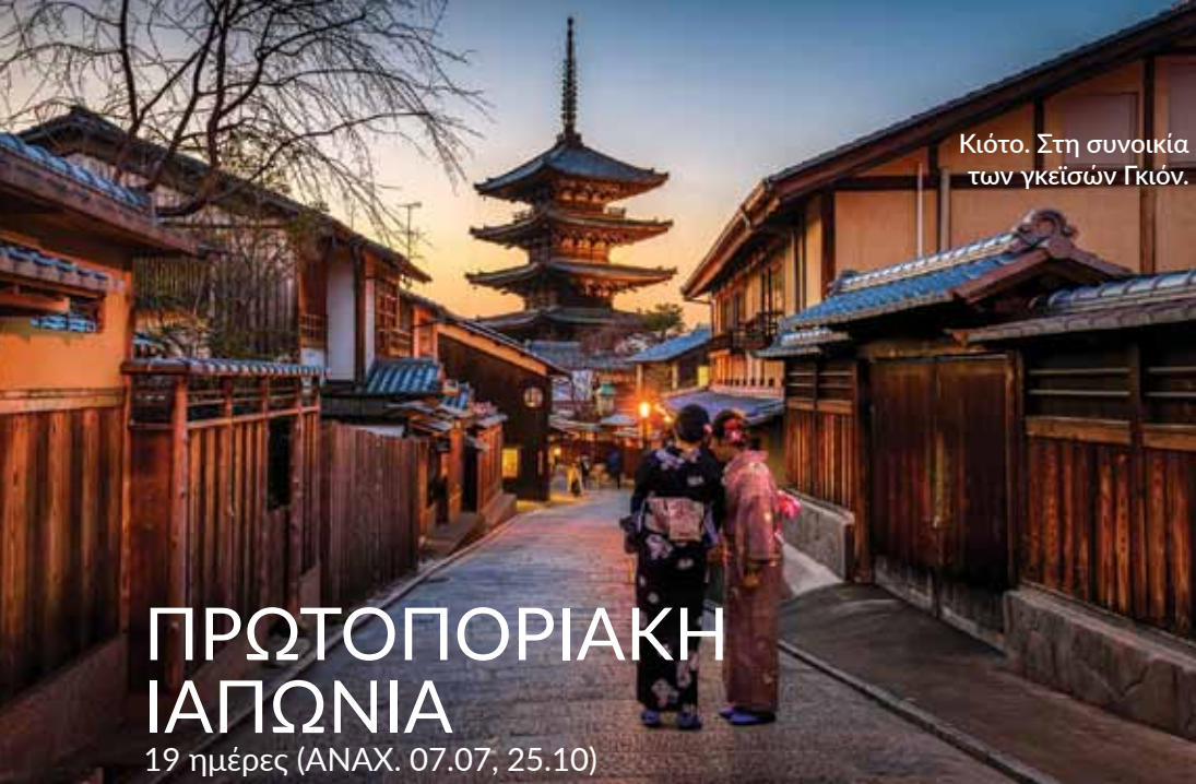
Κιότο. Στη συνοικία των γκειϊσών Γκιόν.