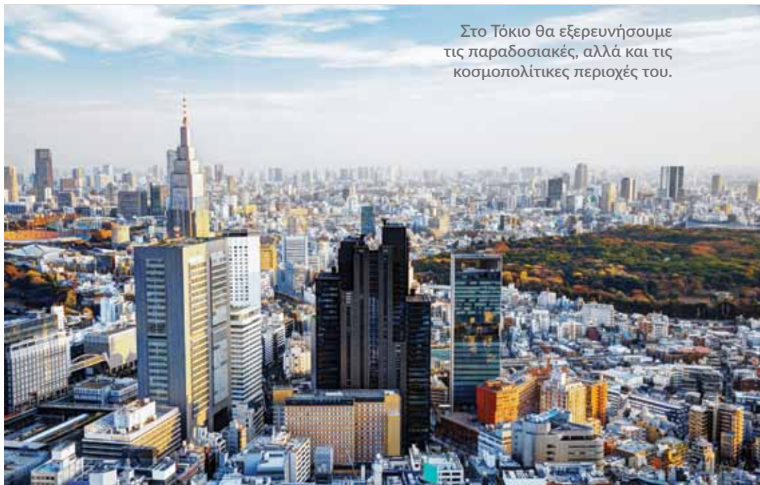
Στο Τόκιο θα εξερευνήσουμε τις παραδοσιακές, αλλά και τις κοσμοπολίτικες περιοχές του.

Θα ξεκινήσουμε με μια βόλτα στον λόφο του ιερού Φουσίμι Ινάρι. Ο τιμώμενος θεός είναι αυτός του ρυζιού και του εμπορίου, ίσως ο πιο δημοφιλής στα νησιά της Ιαπωνίας. Εδώ οι έμποροι έχουν δωρίσει στο ιερό εκατοντάδες ξύλινα πρόπυλα, που τοποθετημένα σε σειρά σχηματίζουν εντυπωσιακές στοές που «φιδίζουν» πάνω στον λόφο. Στη συνέχεια θα δούμε τον βουδιστικό ναό Νταϊγκότζι και μετά θα μεταβούμε στην ιερή πόλη της Νάρα, πρώτη πρωτεύουσα της χώρας. Εδώ γεννήθηκαν η ικεμπίνα, η τέχνη των λουλουδιών, και το μελόδραμα «Νο». «Μόνο αφού δει κάποιος τη Νάρα του επιτρέπεται να πεθάνει» λένε οι Ιάπωνες για την πόλη