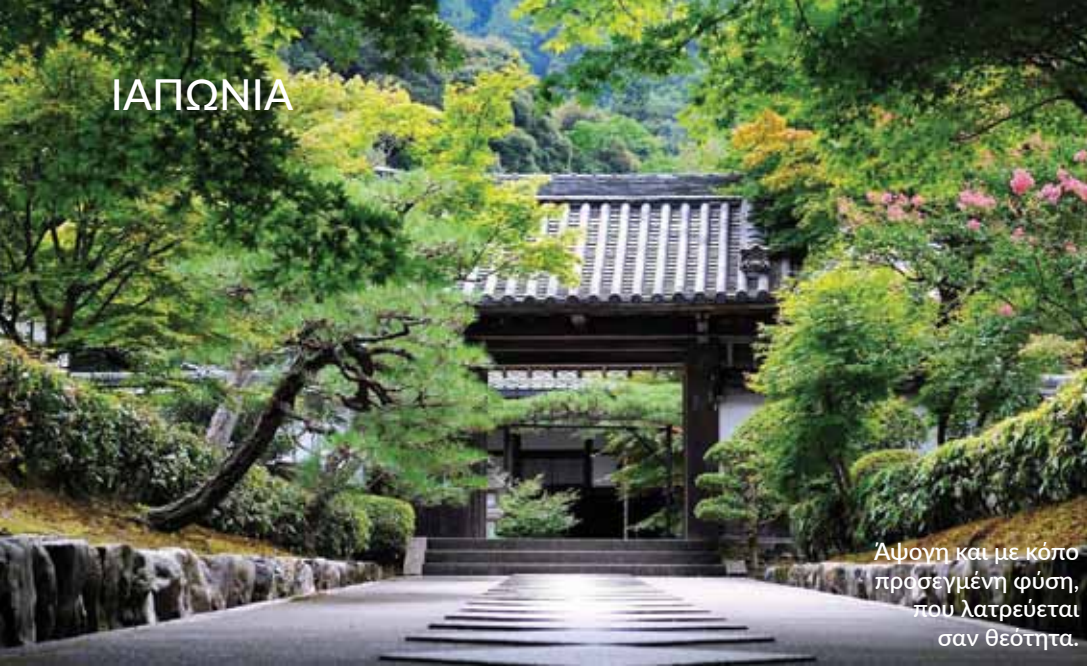
Αψογη και με κόπο πράσιμη φύση, που λατρεύεται σαν θεότητα.

κατευνάσουν τους θεούς και να γλιτώσουν από την αρρώστια, οι ντόπιοι έβαλαν όλη τους την τέχνη για να φτιάξουν τα ωραιότερα άρματα-προσφορές στους θεούς τους: εκεί οφείλεται η απίστευτη πολυπλοκότητα και δεξιοτεχνία που διακρίνει τα yatai που θα έχουμε την ευκαιρία να δούμε εδώ. Δείπνο και διανυκτέρευση.