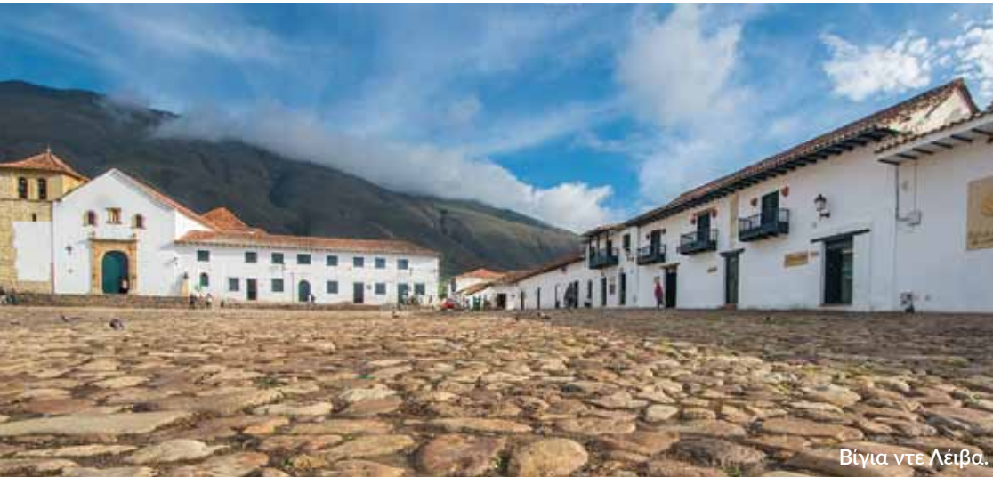
Βίγια ντε Λέιβα.