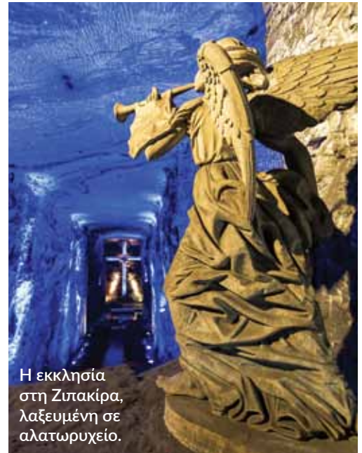
Η εκκλησία στη Ζιτακίρα, λαξευμένη σε αλατωρυχείο.