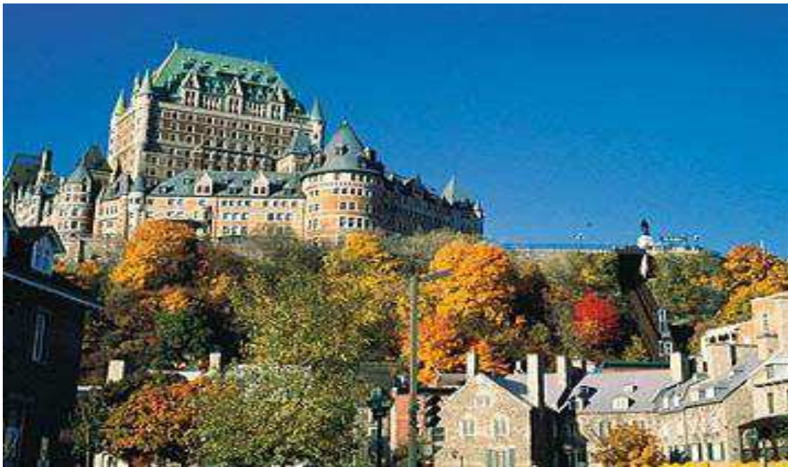
Quebec – Chateau Frontenac