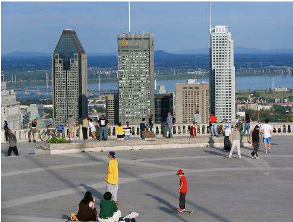
Montreal – Belvedere

Πρωινή ξενάγηση στο Μόντρεαλ, κατά τη διάρκεια της οποίας θα δούμε μεταξύ άλλων το Ολυμπιακό χωριό και το Στάδιο των Ολυμπιακών Αγώνων του 1976, το παλιό λιμάνι, την παλιά συνοικία γύρω από την πλατεία Ζακ Καρτιέ, τον Καθεδρικό Ναό, το Πανεπιστήμιο Mc Gill, το Δημαρχείο, από το μπαλκόνι του οποίου το 1969 ο Ντε Γκωλ εξεστόμισε το περίφημο "Vive le Quebec libre" (Ζήτω το ελεύθερο Κεμπέκ), πυροδοτώντας το διασπαστικό κίνημα του Κεμπέκ και τις τεταμένες σχέσεις με τον Καναδά επί σειρά ετών, το πολυσύχναστο Εμπορικό Κέντρο και τον λόφο Μοντ Ρουαγιάλ. Επιστροφή στο ξενοδοχείο μας. Διανυκτέρευση.